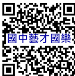
桃園市國民中學藝術才能國樂班 鑑定線上報名系統

主辦機關：桃園市政府教育局 承辦學校：桃園市立福豐國民中學 地 址：桃園市桃園區延平路 326 號 電 話：（03）366-9547 分機 621、619 傳 真：（03）218-1138 網 址： https://www.ffjh.tyc.edu.tw/