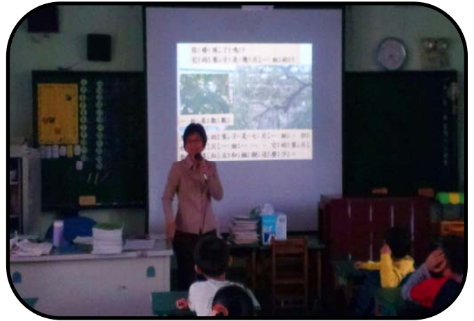
說明：一起來數數黑板樹的葉子