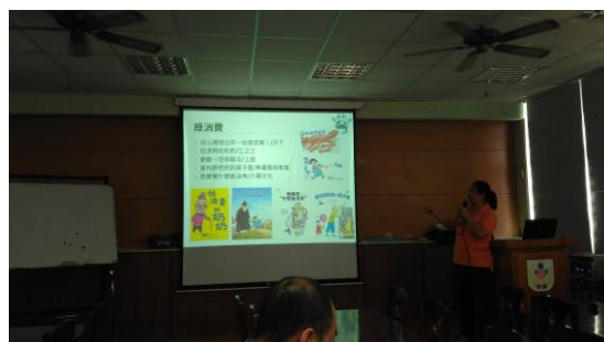
食農教育相關繪本介紹。