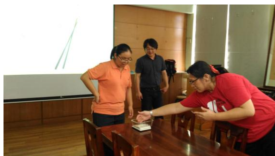
體驗一碗飯約幾粒米。