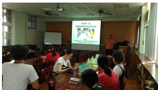
食農教育案例介紹。