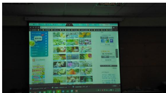
食農教育教學資源介紹。