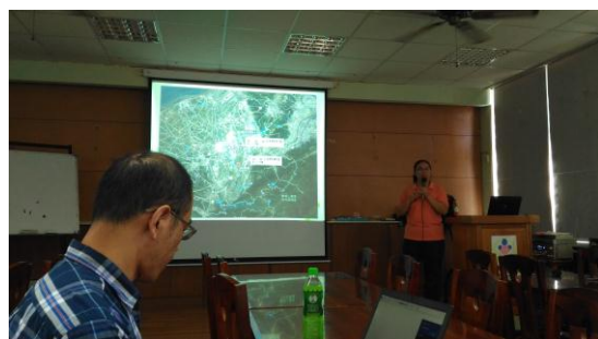
南興國小周邊環境。