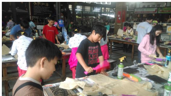
學生們小心翼翼的實作，生怕弄破了紙張