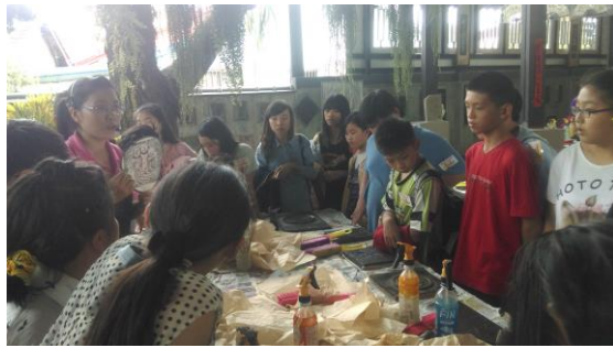
工作人員介紹紙的生產過程