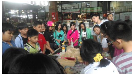
學生們專心聆聽工作人員的解說